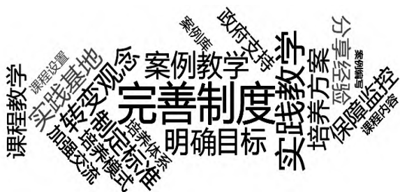
图4 全日制教育硕士研究生培养过程存在问题的解决策略词云图

通过对全日制教育硕士研究生培养过程存在问题的解决策略词云图进行分析发现,排在第一位的策略是完善制度建设、加强管理,占比12.6%;排在第二位的是落实实践教学,占比9.4%;排在第三位的是进一步推进案例教学的实施,占比7.5%;排在第四位的是明确教育硕士研究生培养目标,占比7.3%;排在第五位的是转变传统的学术型研究生的培养观念,占比6.8%;其后依次是制订特色化培养方案(占比6.2%)、加强实践基地建设(占比6.2%)、制订教育硕士研究生教学标准(占比5.8%)、建立教育硕士研究生质量保障与监控体系和改革课程教学(占比5.5%)并列、搭建经验分享平台(占比5.1%)等等(见图4)。