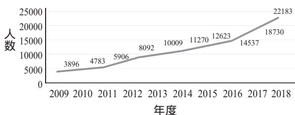
图 1 全日制教育硕士研究生在校人数变化趋势

我国全日制教育硕士研究生教育于 2009 年正式实施,截至 2021 年 11 月,全国共有教育硕士研究生实际招生院校 185 所,全日制教育硕士研究生招生人数呈现逐渐增长趋势(如图 1),招生人数累计 112 029 人 [1] 。